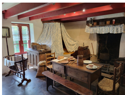
Chaumière Briéronne