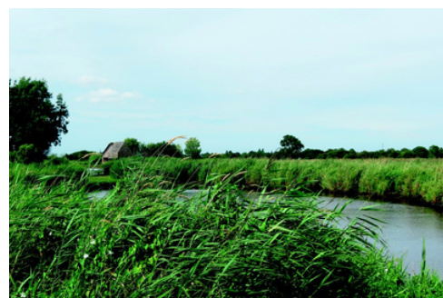
Réserve Pierre Constant