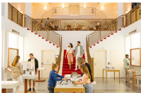
© Escal'Atlantic - Farid Makhoulouf L'humière