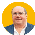
Henri BILLON Président de la Communauté de communes du Pays de Landivisiau, président du Pays de Morlaix, maire de Loc-Eguiner et agriculteur

Le temps n'est-il pas venu d'exercer un droit d'inventaire du modèle agricole qui a prévalu en Bretagne depuis 60 ans ? Quelles sont ses contributions et ses limites ? Que faut-il garder de cet héritage et que faut-il transformer ?