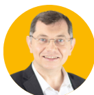
Jean-Paul VERMOT Maire de Morlaix